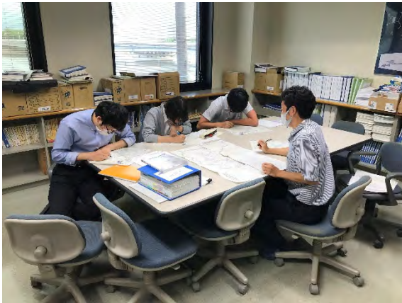
新入社員勉強会の様子