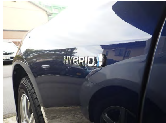
社用車のハイブリッド化